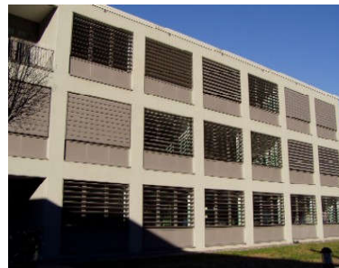
SEDE DI OMEGNA

Per informazioni, programmi ed iscrizioni: www.vcoformazione.it